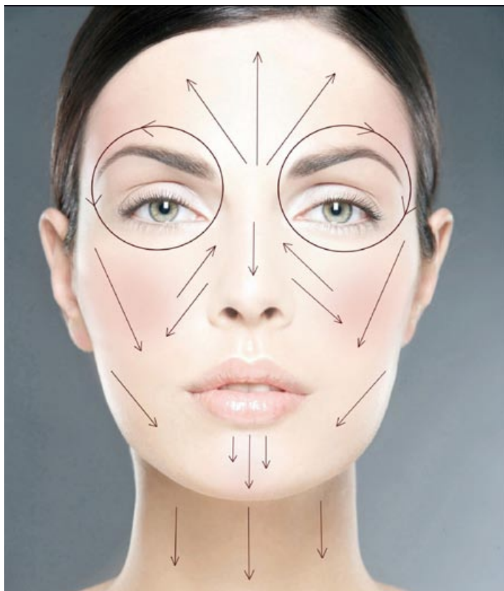
KIERUNEK PUDROWANIA. CAŁA TWARZ: Z GÓRY NA DÓŁ. RUCH PĘDZLI: Z DOŁU DO GÓRY.

Wśród pudrów sypkich można wyszczególnić puder z brokatem,